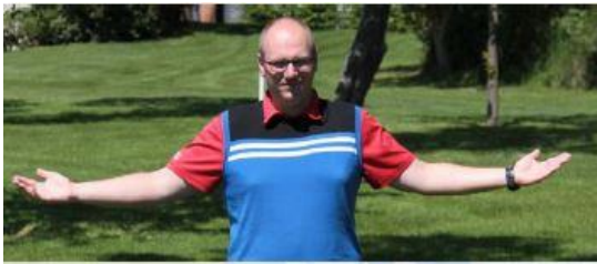
Arme wie ein „W“ Ball nicht gesehen

Folgende Gesten haben sich durchgesetzt: