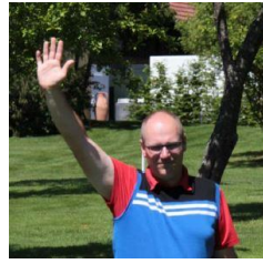
Ein Arm hochgestreckt: Ball ist auffindbar und / oder Drivezone ist frei